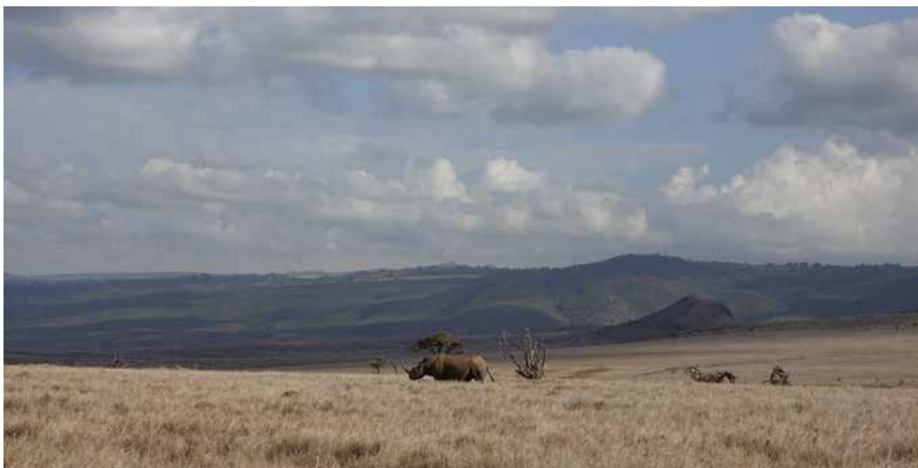
Lewa Wildlife Conservancy, Kenya : patrimoine naturel mondial de l'UNESCO.