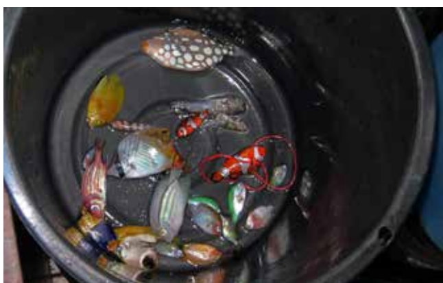
— Du poisson en déchet : 4 poissons coralliens sur 5 meurent au cours de leur transport vers les aquariums.

Les récifs de corail comptent parmi les espaces vitaux les plus riches en espèces de notre planète. Toutefois, la pollution, le réchauffement climatique, la surpêche et bien d'autres dangers menacent ces « forêts tropicales des mers ». A cela s'ajoute le fait que l'industrie des aquariums pille ces espaces sans scrupules.