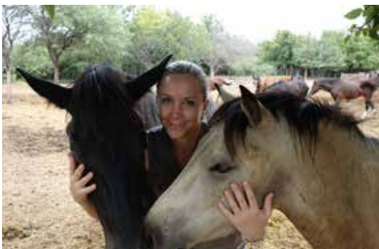
27 Nouvelle vie pour les chevaux libérés de leur souffrance au sanctuaire Equidad