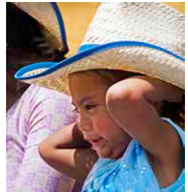
— La corrida nuit au psychisme des enfants confrontés à cette brutalité.

La Fondation est partenaire d'organisations au niveau local et jusqu'à l'ONU. Sa campagne phare « Enfance sans violence » démontre que la corrida viole la convention internationale des droits de l'enfant. De ce fait, afin de protéger la plus jeune génération, l'ONU exhorte aujourd'hui les pays taurins à n'exposer les enfants ni activement ni passivement à la brutalité des combats de taureaux. Car ces derniers mettent en danger et blessent beaucoup de gens. Quant au niveau européen, la FFW demande que l'UE cesse de subventionner la corrida avec la campagne #NoMoreFunds.