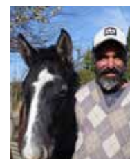
Martín Vizcarra Soins des chevaux, Equidad, Argentine