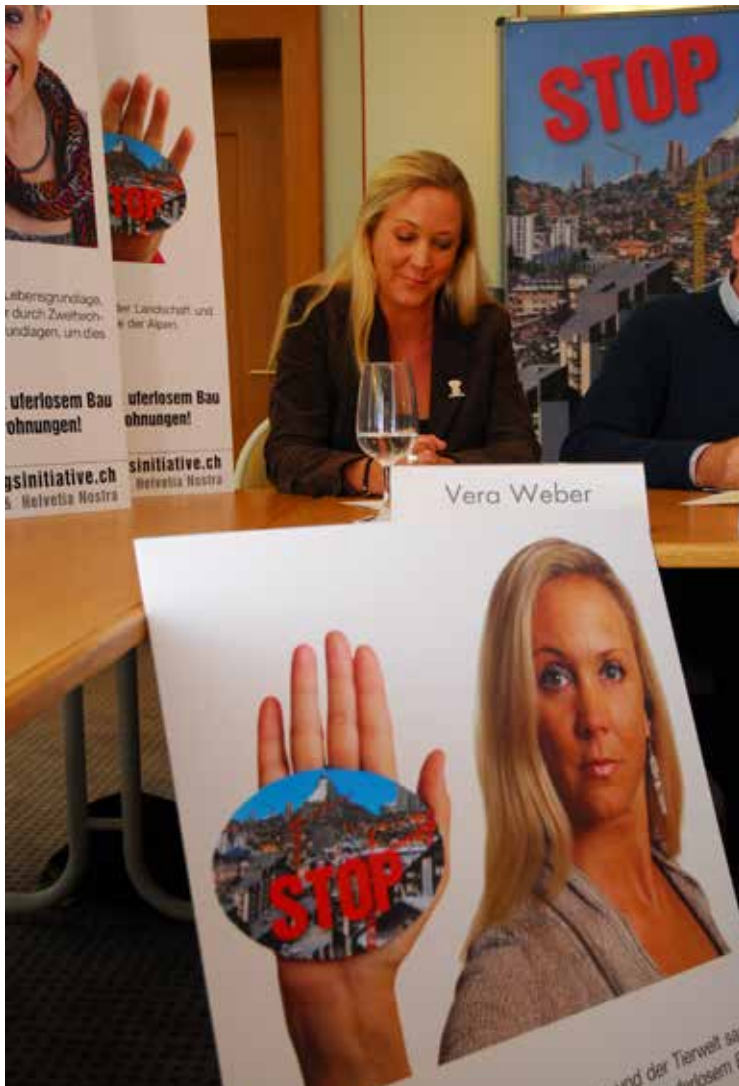
Vera Weber fut à la tête de la campagne pour l'initiative sur les résidences secondaires qui fut acceptée par le peuple suisse.

Dans le cadre de sa campagne contre plusieurs gigantesques projets de construction dans les montagnes valaisannes, Helvetia Nostra a obtenu gain de cause, en 2016, avec le WWF et la Fondation suisse pour la protection et l'aménagement du paysage contre Aminona Luxury Resort and Village SA, qui avait planifié des constructions éparses impliquant cinq tours pour des hôtels, des résidences principales et secondaires, ainsi que des commerces.