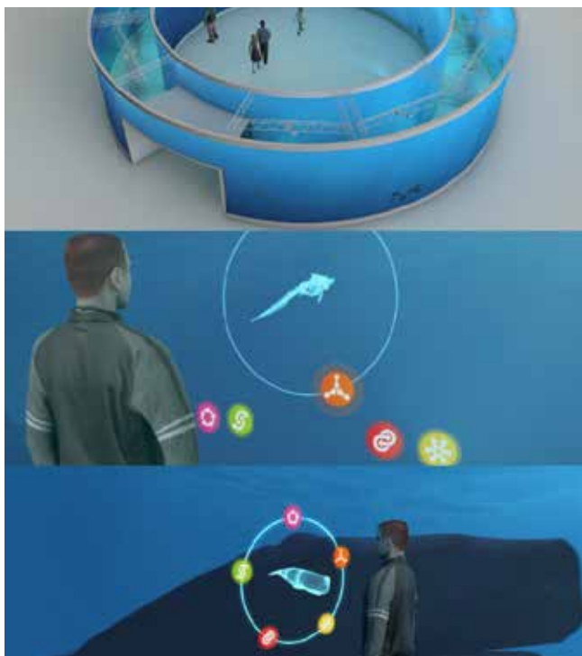
— Grâce aux technologies actuelles, nous pouvons montrer les habitants des fonds marins et de l'océan dans leurs milieux naturels. Sans capture ni souffrance. C'est le but de Vision NEMO.

La FFW propose un contre-projet moderne : Vision NEMO, la première porte multimédia sur l'océan ( www.vision-nemo.org ). Ce projet permet de montrer, d'observer et d'étudier les animaux marins sans les enfermer dans un aquarium. Grâce aux technologies actuelles et futures, Vision NEMO vise à présenter les mers du monde telles qu'elles sont vraiment, dans toute leur beauté, mais sans en cacher les menaces. Vision NEMO crée un lien nouveau et unique entre le public, la recherche, la science, la protection des animaux, des espèces et de l'environnement.