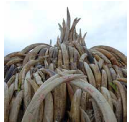
— La soif d'ivoire tue les éléphants pour des objets dont personne n'a besoin.

La Fondation Franz Weber mène différents projets dans son combat pour assurer la survie des éléphants d'Afrique. Elle est ainsi observatrice à la CITES depuis 1989. Dans ce même cadre, elle fournit un soutien scientifique, logistique et financier à la Coalition pour l'Éléphant d'Afrique. Cette dernière regroupe plus de 30 pays d'Afrique ayant pour objectif commun « d'assurer l'existence d'une population d'éléphant saine et viable, protégée des menaces que représente le commerce de l'ivoire. »