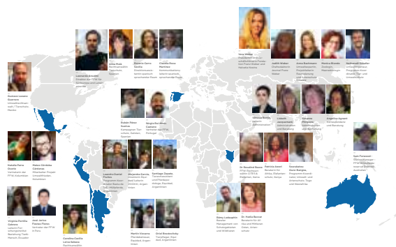
24 L'équipe de la Fondation Franz Weber et d'Helvetia Nostra